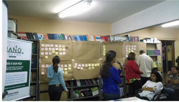
FIGURA 10 - REGIÃO SANTOS DUMONT.