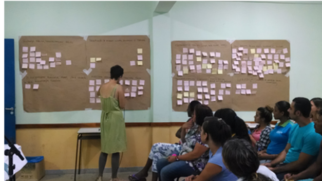
FIGURA 9 - AUDIÊNCIA REGIÃO PALMITAL.