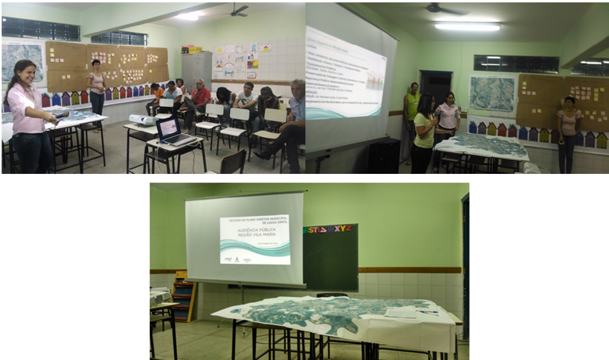
FIGURA 8 - AUDIÊNCIA REGIÃO VILA MARIA.