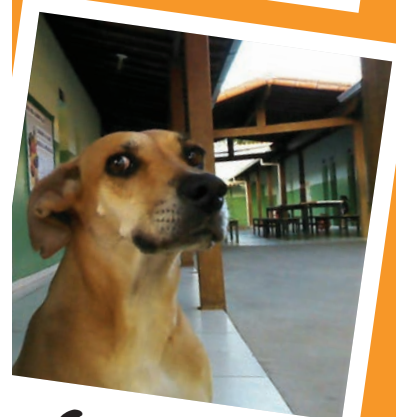
Com a turma