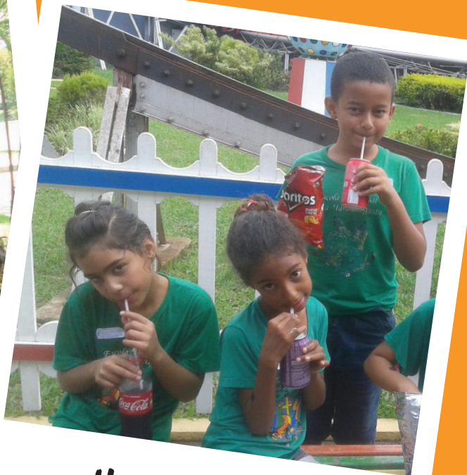
Hora do lanche