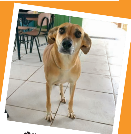
Olhos de mel