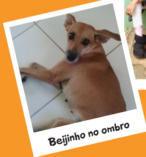
Beijinho no ombro