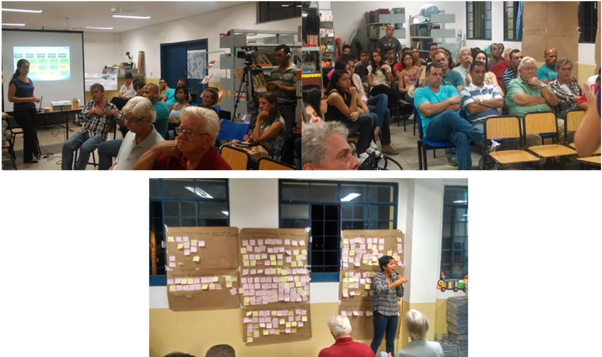
FIGURA 15 - AUDIÊNCIA REGIÃO CENTRO.