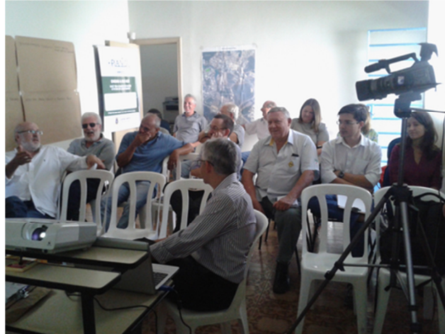
FIGURA 14 - AUDIÊNCIA DISTRITO INDUSTRIAL.