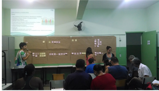
FIGURA 13 - AUDIÊNCIA REGIÃO FRANCISCO PEREIRA.