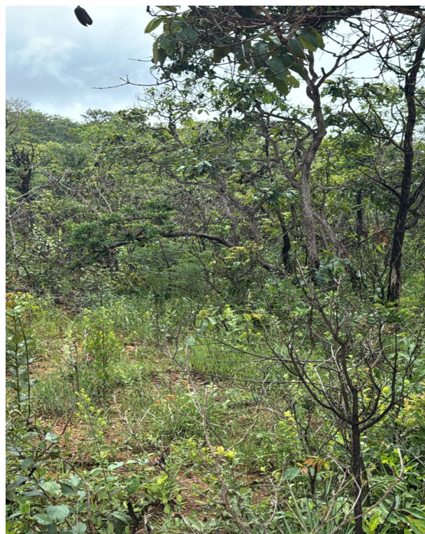
Foto 08: Destaque para paus terra da folha larga (Lote 04 – Quadra 04).