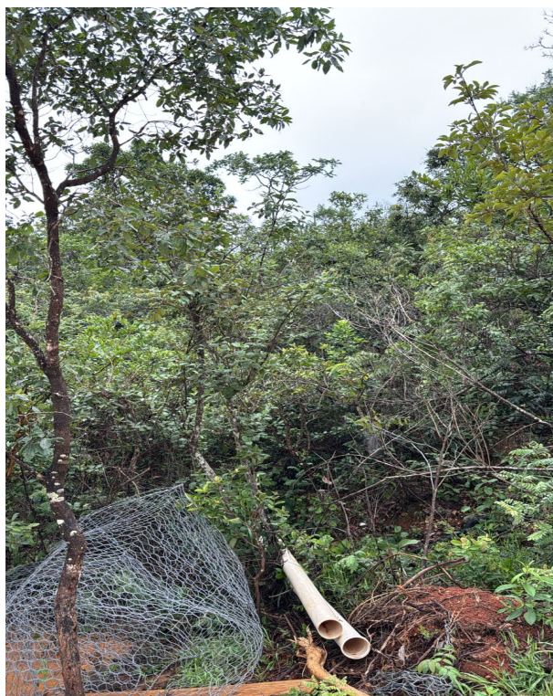
Foto 02: Capitão do campo na área da intervenção (Lote 04 – Quadra 02).