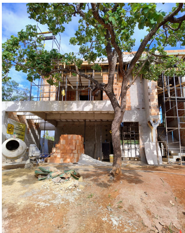
Foto 03: Pequizeiro apenas com galhos sobrepostos na área construída.