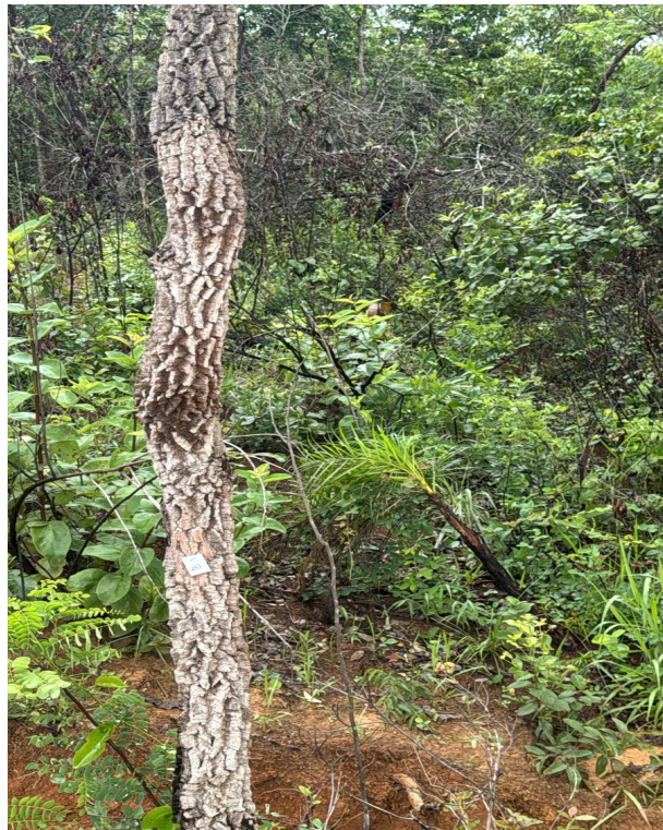
Foto 06: Destaque para pau terra da folha larga (Lote 06 – Quadra 04).