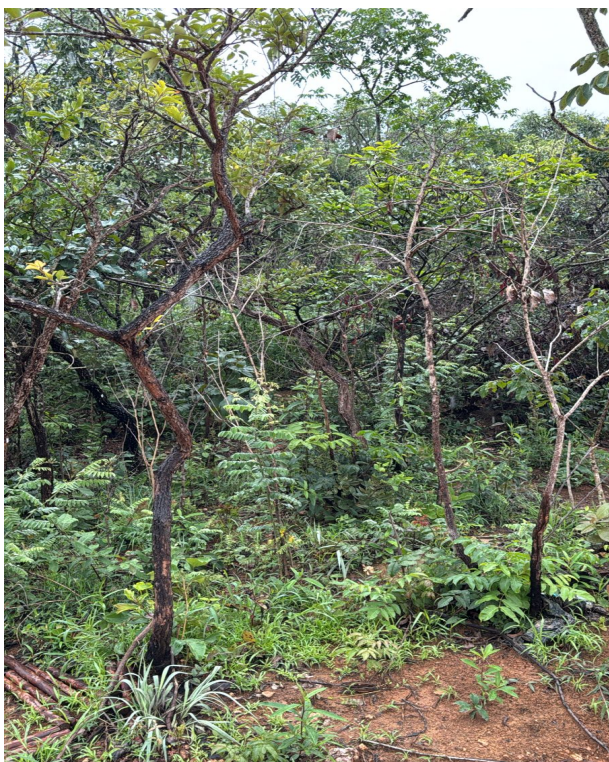
Foto 01: Destaque para paus terra da folha fina, Gonçalo Alves e ipê amarelo do cerrado (Lote 04 – Quadra 02).