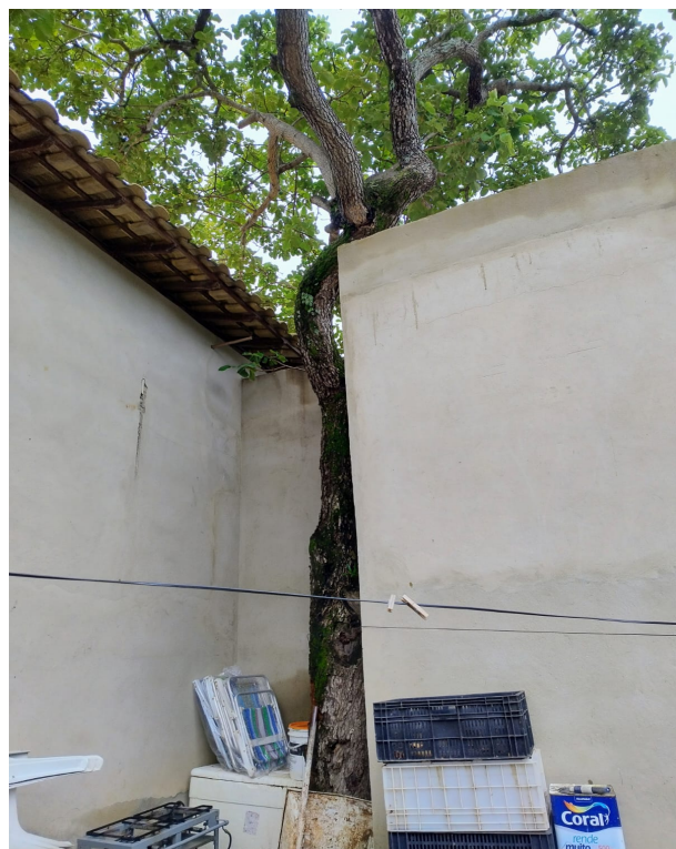
Fotos 01 e 02: Tronco rente à alvenaria com galhos sobrepostos na área construída.