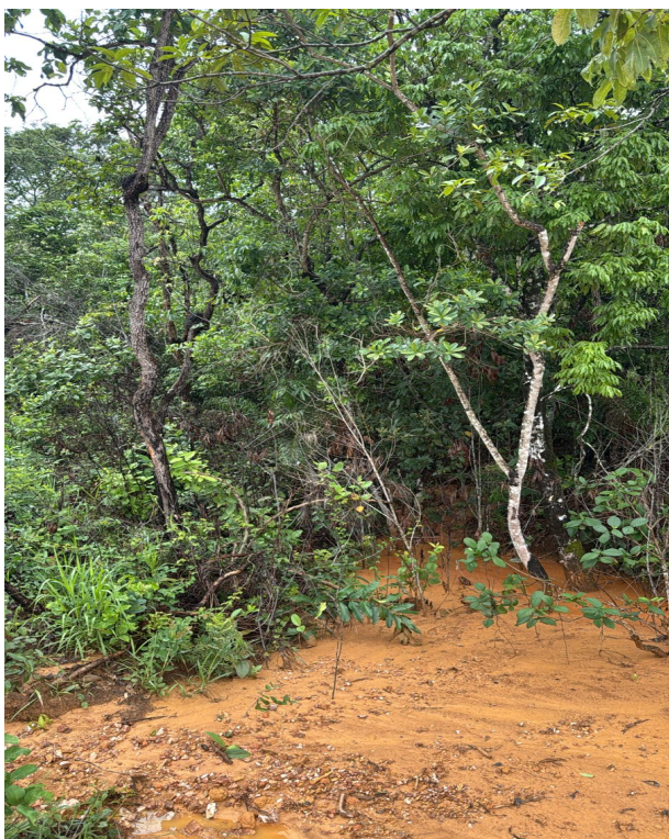
Foto 07: Área baixa do terreno que será aterrada (Lote 06 – Quadra 04).