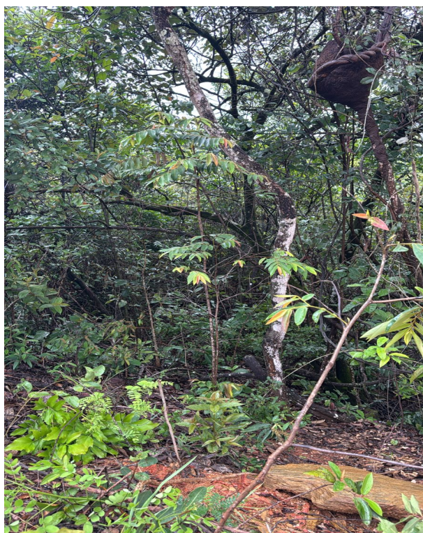
Foto 04: Densa vegetação arbórea na área da intervenção, com destaque para pimenta de macaco (Lote 03 – Quadra 02)