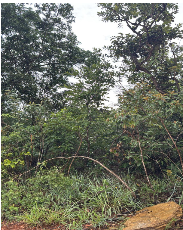
Foto 03: Destaque para jatobá e pau terra da folha larga (Lote 03 – Quadra 02).